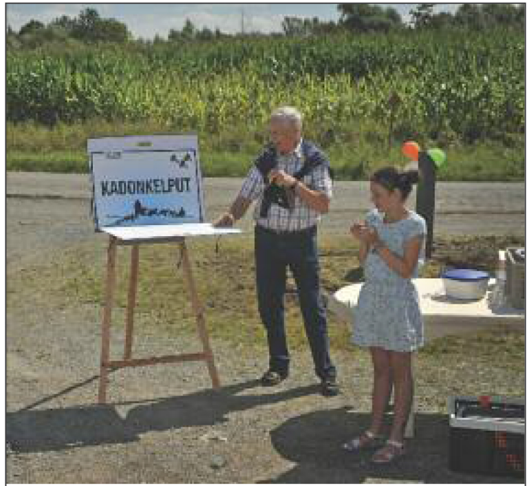
Onthulling van het plaatsnaambord: Kadonkelput.

De burgervader, nog onder de indruk niet alleen van de mooie naam Clémence (“ook dat nog”), zag dat het heel goed was. Hij werd uitgenodigd het gemeentelijk plaatsnaambord te onthullen, wat onder een gewaardeerd applaus gebeurde. De naamplaat schitterde op een schildersezal en even werd het stil. Wat verder balkte een echte ezel puur uit contentement veel meer dan drie keer. En de namiddag die konkelde gezellig voort. Met een drink en wat foto's werd Kadonkelput op een passende wijze ingehuldigd en vereeuwigd. We sloten af met het goede voornemen dit verlaten plekje om te vormen tot een veilige en fleurige zitplaats. Het buurtfeest kon nu echt beginnen.