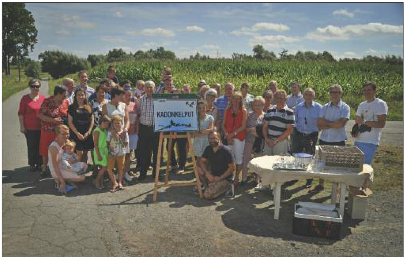
Groepsfoto aan Kadonkelput.